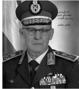
پاشوری پدشیر موشیر کامیل زین