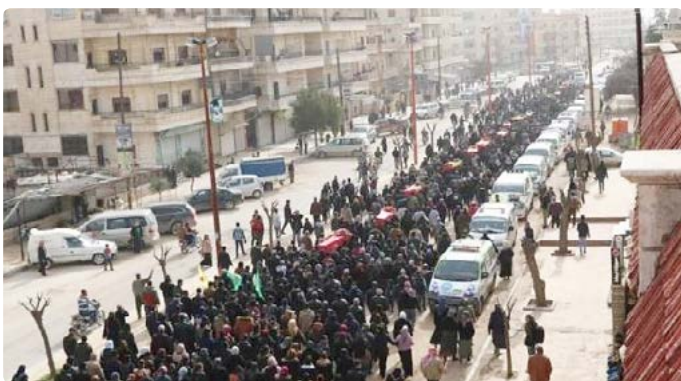
Beerdigung der von der türkischen Armee in Afrin getöteten Zivilisten

Syriens Diktator Baschar al Assad wiederum kommt eine Schwächung der Kurden durchaus gelegen. Denn wenn er mit einer isolierten Zone in Afrin spezielle Beziehungen herstellen könnte, würde ihn das innenpolitisch stärken. Für die Großmächte ist das kurdische Dilemma nur ein kleines Puzzlesteinchen im Spannungsverhältnis zwischen Ost und West, zwischen Islam und Moderne, zwischen Iran und den Sunniten. Man benutzt die Kurden im Kampf gegen den IS und lässt sie fallen, wenn vermeintlich wichtigere Interessen zu bedienen sind. Russland enttäuscht dabei auf breiter Linie. Man kann nicht so viel fressen, wie man kotzen möchte.