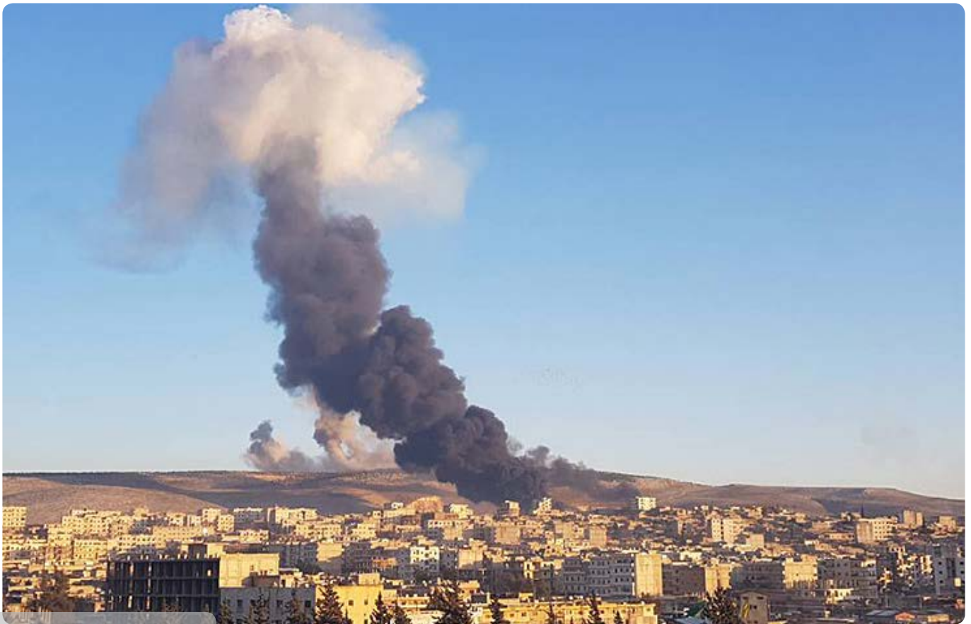
Türkei bombardiert syrische Kurdenregion