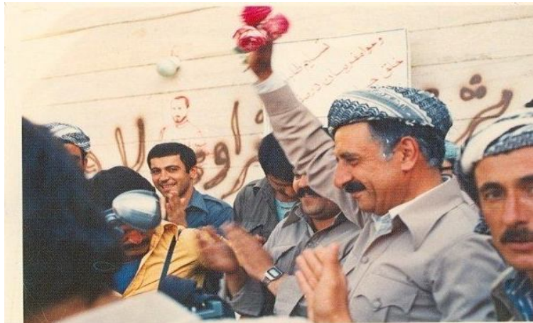
دوكتور عهبدوهرمان قاسملوو، سكرتيرى حيزبى ديموكراتى كوردستانى ئيران

دوباره دهكرانه وه، هيج پيوه ندييه كيان به كيشهى رهواى نه ته وهى كورد و داخوازيه كانيه وه نه بوو. رۆژ، رۆژى