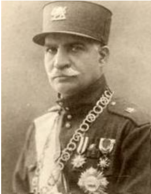
ره‌زاشا دامه‌زیننه‌ری رژیمی په‌هله‌وی

ئەم حەشاماتە زۆرە کاتیک گەرانەوہ بۆ ئێران، ئەو بیروبیاوہ پرە نوئیە ی وا فیری ببوون، بۆ خەلکی شاروگەند و زیدی خویان گێراپەوہ. کاتیکیش یەکەمین ریکخراوہی کۆمۆنیستی بەناوی "حیزی کۆمۆنیستی ئێران" لەمانگی جۆزەردانی سالی 1299 ی هەتاوی بەرامبەر بە مانگی جۆنی 1920 ی زانی، لەپاریژگە ی گیلان کە هاوسنورە لەگەڵ یەکیتی سۆڤیت، لەلایەن کەسایەتی سیاسی و رۆشنبیری ئەو سەردەمە ی ئێران بەنیوی حەیدەر عەموونوغلای یەوہ دامەزیندرا و، ئەکادیمیەکی ناوداری وەک دۆکتۆر تەقی ئەرانی بوو بە ئەندامی حیزبەکە، ئەم حیزبە توانی لەماوہیەکی کەمدا لەنیو کۆپوکۆمەلە ی رۆشنبیری و کریکاری لەئێراندا بەخیری گەشەبکات.