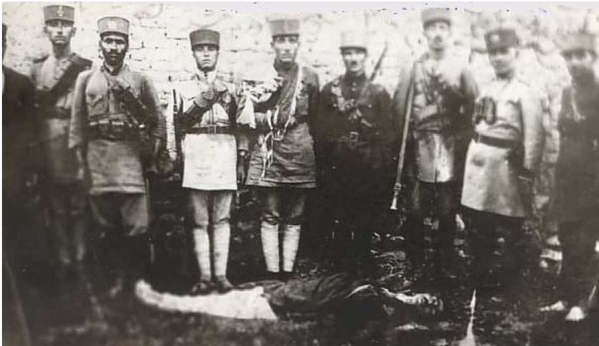
ھىزەكانى رژیى رەزاشا، دوای گوللەبارانکردنى سەركردەى نەتەوہىيى سەكۆى شكاک، وینەى یادگارىيى دەگرن

(شۆرشى نوڭخوۋازى)، كە بەخوڭنى ھەزاران ئازادىخوۋاز بەدەستەيىنرابوون، زىندانەكان پىكران لە ئازادىخوۋازان و رۆژنامەنووسان و، ھەرچىيەك رۆژنامەى سەربەخۆ ھەبوون، داخران. ترس و شەوہزەنگ، جىيى سالانى ئازاد و دىمۆكراتى سەردەمى ھەوتسالەى شۆرشى نوڭخوۋازىيان گرتەوہ.