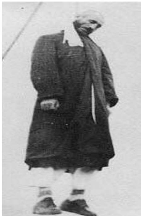
له سیناره دانی پیشه وای کورد له لایه ن حه مه ره زاشاوه

سالیکی دوای کۆتاییهاتی جهنگی جیهانی دووهم، ریکه وتی (۲) ی ریبه ندانی ۱۹۴۶، له شاری مه هاباد، کۆماری سه ره به خۆی کوردستان دامه زرا. به چه ند مانگیکی دوای دامه زرانی کۆمار، به نه خشه ی ئینگلیز، ریکه وتنیککی ساخته له نیوان قه وامولسه لته نه سه رۆکوه زیرانی ئیران و، ستالین دیکتاتۆری به کیتی سۆفیت مۆرکرا. سوپای روسیا له کوردستان چوه ده ره وه و، سوپای ئیرانی به پشتیوانیی ئینگلیز و ئەمریکا توانییان کۆماری کوردستان و، نازه ربایجان بپووخین و، سه ره له نوێ ده سه لاتی رژیمی په هله ویی به سهر ئیران و رۆژه لاتی کوردستاندا دابه سه پیننه وه.