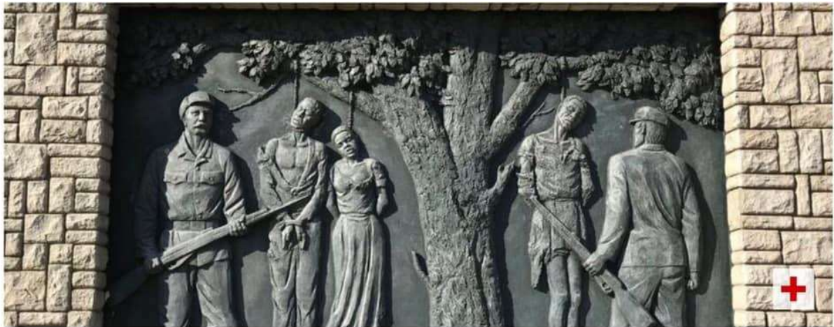
Denkmal in Windhuk in Namibia zur Erinnerung an den von deutschen Kolonialtruppen begangenen Völkermord an den Herero und Nama