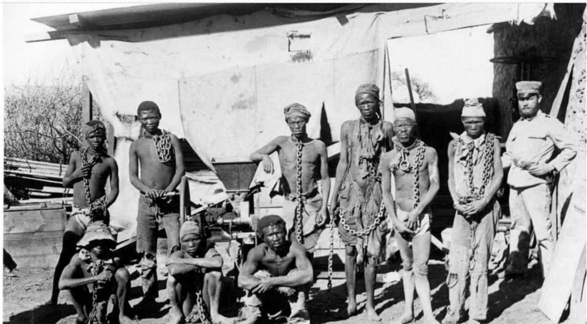
Undatierte Aufnahme von Kriegsgefangenen des Deutschen Reichs in der damaligen Kolonie Deutsch-Südwestafrika, dem heutigen Namibia