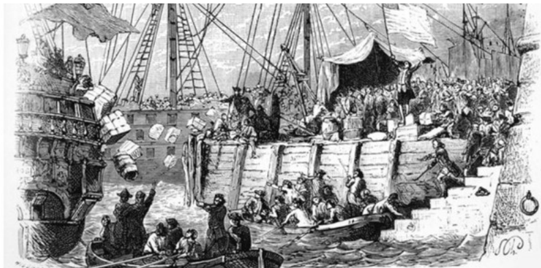
Der militante Protest Bostoner Händler und Bürger am 16. Dezember 1773 gegen britische