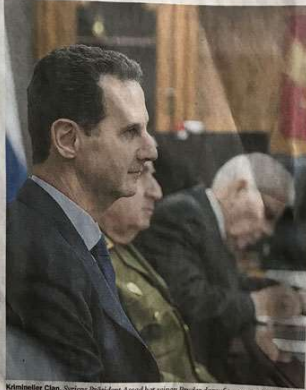
Ministerialer Clan. Syriens Präsident Assad hat seinen Bruder darauf angewiesen, Drogenfabriken zu besetzen und den Anlandetransport zu organisieren.