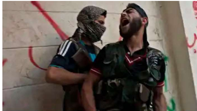
Free Syrian Army fighters in Aleppo ... many in the conflict are using the drug to keep going.