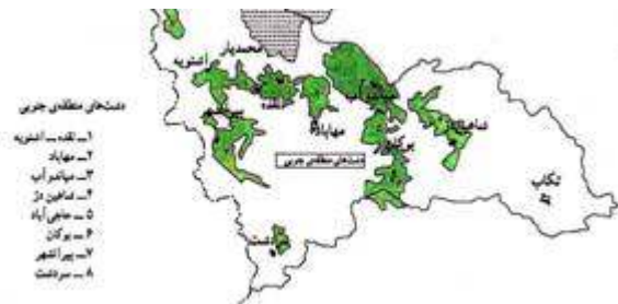
نقشه پراکنش دشتهای جنوب استان

در شهرستان بوکان دشت بوکان و دشت حاجي آباد واقع شده است که در مورد اين دشتها توضيحاتي را ارائه مي نماييم.