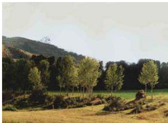
نمایی از دشت بوکان

این دشت ۲۳۵۰۰ هکتار وسعت داشته و در جنوب استان آذربایجان غربی و جنوب دریاچه ارومیه واقع شده است و دارای ۴۹ پارچه آبادی است. از عمده ترین محدودیتهای اراضی قابل کشت آبی جنس خاک و توپوگرافی است. کل سطح زیرکشت دشت بوکان در سال ۱۳۷۰ بالغ بر ۲۱۹۰۳ هکتار بوده که ۸۵۷۳ هکتار آن آبی و ۱۳۳۳۰ هکتار نیز دیم است. محصولات عمده زراعی در کشت آبی گندم، یونجه (به همراه اسپرس و شبدر) و جو و در کشت دیم گندم و جو می باشد. آب مصرفی دشت عمدتاً از منابع سطحی تأمین می گردد و رژیم اصلی آب سطحی این دشت نیز سیمینه رود می باشد که از شاخه های متعددی تشکیل یافته و در جهت کلی جنوب به شمال در دشت بوکان جریان دارد.