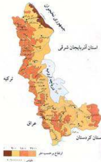
نقشه بررسی وضعیت توپوگرافی شهرستان بوکان

شهرستان بوکان با وسعت ۳۰۶/۲۵۴۱ کیلومتر مربع، حدود ۶/۵۰ درصد از سطح استان را به خود اختصاص می‌دهد. این شهرستان در ارتفاعی حدود ۱۰۰۰ تا بیش از ۲۰۰۰ متر از سطح دریا بوده و شیب متوسط وزنی آن ۸ درصد محاسبه گردیده است. از سطح شهرستان ۳۱/۳۰ درصد اراضی کوهستانی، ۷۲/۲۹ درصد تپه‌ها و ۹۶/۳۹ درصد بقیه را اراضی دشتی، سیلابی و ... تشکیل می‌دهند. از نظر مختصات جغرافیایی در ۳۶ درجه و ۳۲ دقیقه عرض شمالی و ۴۶ درجه و ۱۳ دقیقه طول شرقی واقع گردیده است.