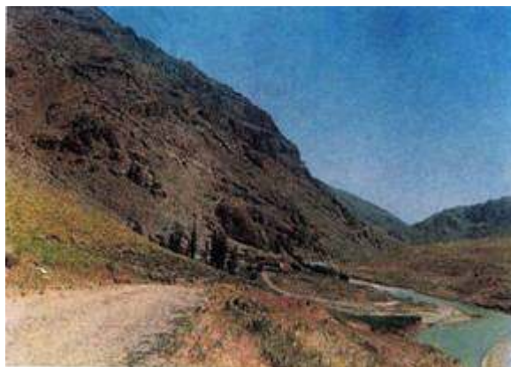
نمایی از کوهستانهای شهرستان بوکان

شهرستان بوکان تپه‌ماهوری بوده در غرب و جنوب‌غربی آن ارتفاعات جوانمرد با ارتفاع ۲۰۹۸ متر و کوه‌نیسان با ارتفاع ۲۴۱۰ متر و تپه‌ماهورهای سه‌کانیان و کانی‌سنجد با ارتفاع ۱۳۰۰ متر و کوه داغداران با ارتفاع ۱۳۰۰ متر در غرب رودخانه سیمینه‌رود و ارتفاعات کانی‌سیب با ارتفاع ۲۰۵۰ متر در حد فاصل سردشت و شهرستان بوکان از ارتفاعات مهم منطقه هستند.